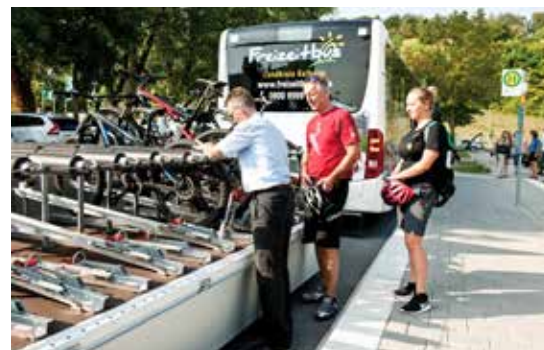
Problemlöser Fahrradtransport mit dem Freizeitbus

Die Freizeitbusse verkehren bis einschließlich 3. Oktober an Sams-, Sonn- und Feiertagen entlang malerischer Rad- und Wanderwege,