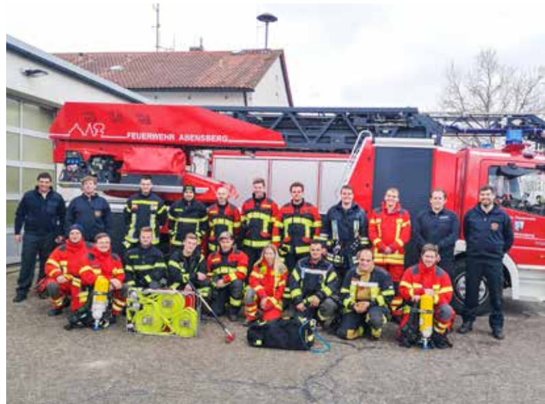
Die Teilnehmer aus dem Landkreis Kelheim mit den Verantwortlichen