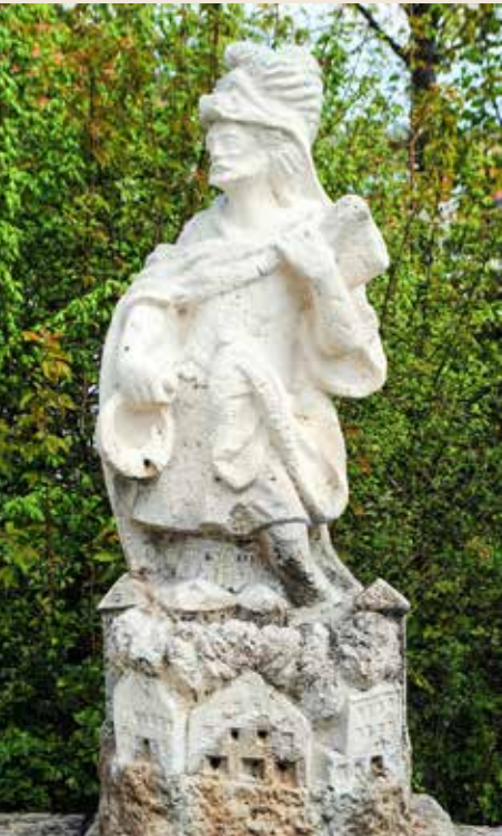
Der St.-Florians-Brunnen (hier im April noch ohne Wasser) vor dem Gelände der Freiwilligen Feuerwehr Holzgasse