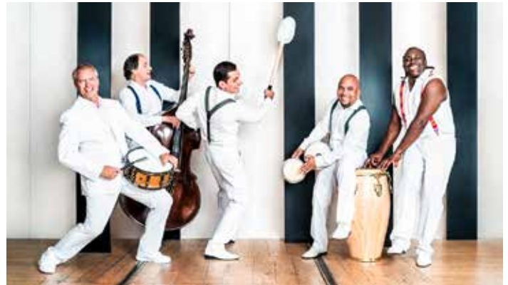
Garantieren beste Stimmung: die Klazz Brothers

scher Musik verschrieben haben. Beethoven klingt hier leichter, unbeschwerter als im klassischen Original. Die berühmtesten Stücke des Bonner Meisters stehen in Kelheim auf dem Programm, wie die 9. Sinfonie, die Mondscheinsonate, die Schicksalsinfonie und Elise, um nur einige zu nennen. Das mehrfach preisgekrönte Quintett Klazz Brothers & Cuba Percussion verbindet mit über 250.000 allein in Deutschland verkauften CDs eine außergewöhnliche Erfolgsgeschichte, die im Jahr 2000 ihren Anfang nahm. Die Klazz Brothers sorgen mit beispielloser Kreativität weltweit für musikalische Furore. Vor genau zwei Jahren hätte das Konzert stattfinden sollen. Alle anderen Veranstaltungen zum