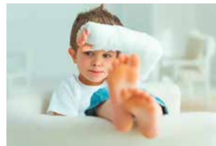
Heile, heile, Gänschen – bald ist alles wieder gut.