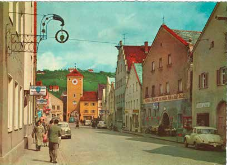
„Altmühlstraße mit Altmühltor“: Ansichtskarte aus den 50er Jahren