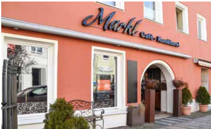
Nach 149 Jahren ist Schluss für die Familie Markl.