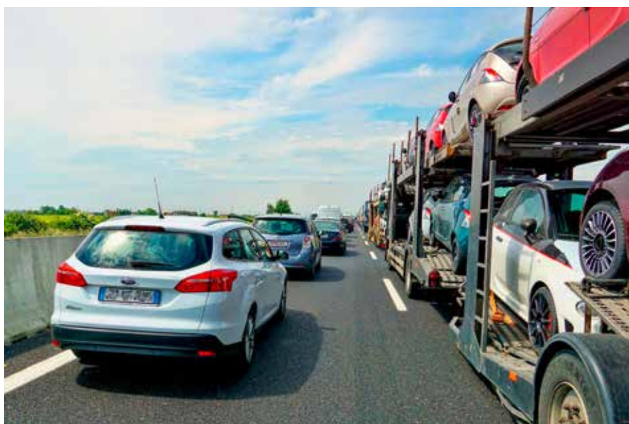
Typische, nicht ungefährliche Überholmanöver

verletzten Personen von 3 auf 1. Lesen Sie den ausführlichen Verkehrsbericht auf www.der-kelheimer.de