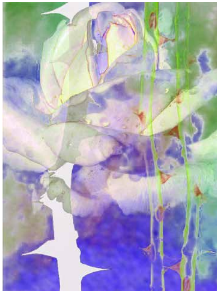
Rose in Blau