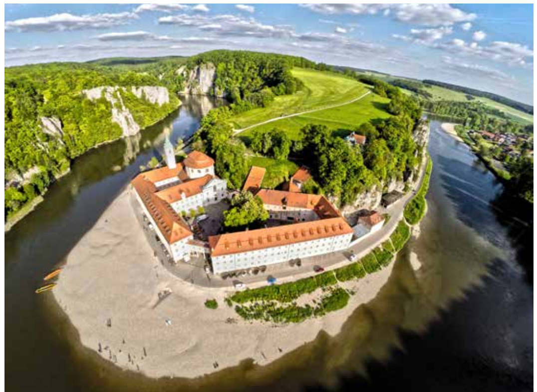
Blick auf Kloster Weltenburg: „Gäste werden sich mittelfristig für Regionen mit geringer Anfahrt interessieren“

Regionen mit geringer Anfahrt interessieren werden.“