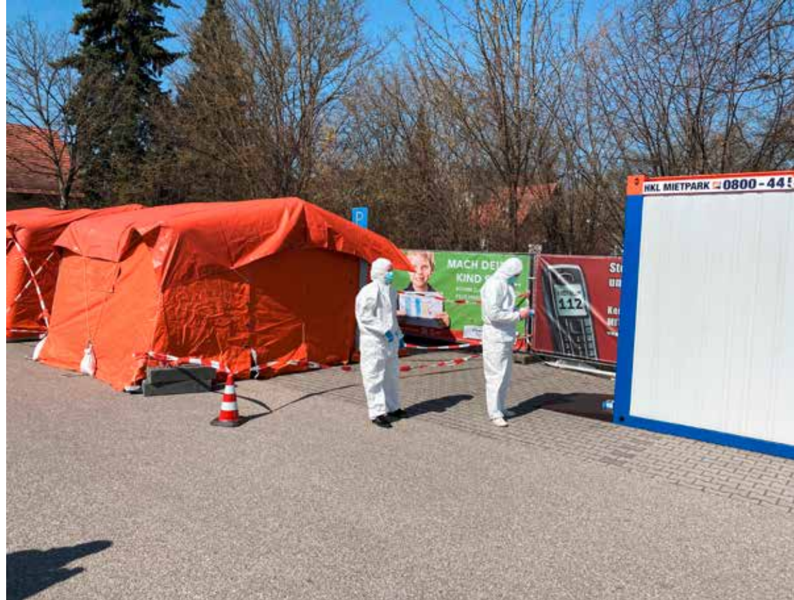
Unter den freiwilligen Mitarbeitern sind viele Medizin-Studenten

Viele der Mitarbeiter an den Teststationen sind Medizin-Studenten, die freiwillig mitarbeiten. Vorlesungen finden momentan nicht statt. Ausgestattet mit Schutzbrille, Kittel, Mundschutz und Handschuhen warten sie vor den Büro-Containern auf die nächste Testperson. Die Termine werden dabei im 10-Minuten-Takt vergeben. Die Mitarbeiter erklären dem jeweiligen Patienten, wie sie die Beprobung durchzuführen haben. Jeder Patient erhält ein steril verpacktes Test-Stäbchen, mit dem er im Rachen einen Abstrich nimmt. Anschließend steckt er es in ein flüssigkeitsgefülltes Röhrchen und verschließt es – fertig. Falls es doch mal zu Problemen kommen sollte, wären zu jeder Zeit an beiden Teststationen Mitarbeiter von Sicherheitsfirmen da, die zum einen den sogenannten