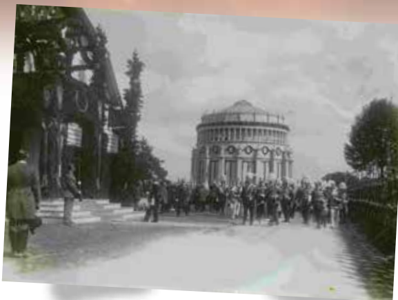
Im „Kaiserjahr“ 1913 besuchte Wilhelm II. die Befreiungshalle. Ihm zu Ehren war ganz Kelheim geschmückt.