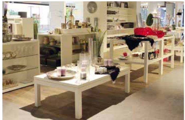
aus der Ausstellung