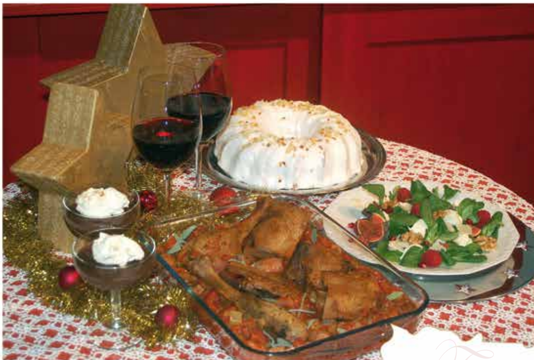
Gänsekeulen mal als Schmortopf, zuvor ein Salat mit Feigen

Die „Cantina & Co“-Chefin hat für unsere Leser wieder ein exklusives Rezept