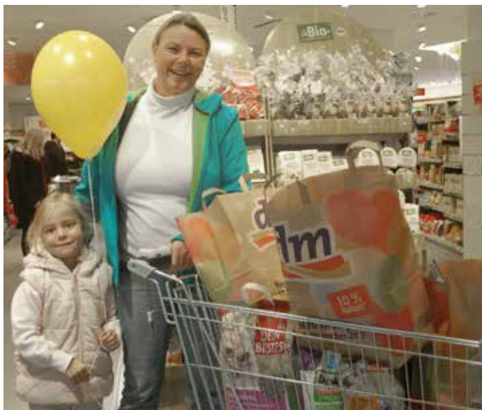
„Durch die Rabatt-Aktion habe ich 21 Euro gespart“, freute sich diese Kundin.