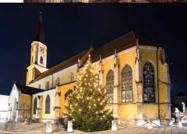
Weihnachtlich beleuchtet: die Stadtpfarrkirche Mariä Himmelfahrt in der Kelheimer Altstadt mit dem traditionellen Christbaum