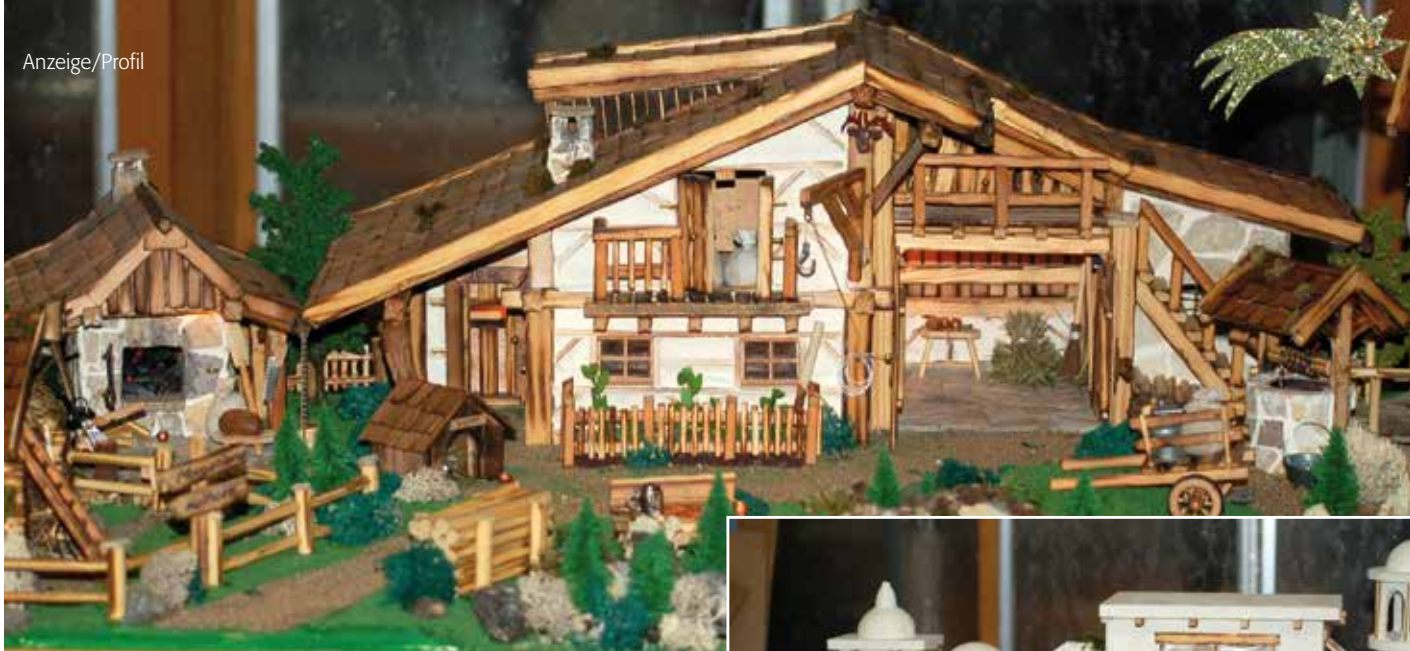
Eine sehr aufwändige Arbeit von Bernhard Bäuml aus Kelheim