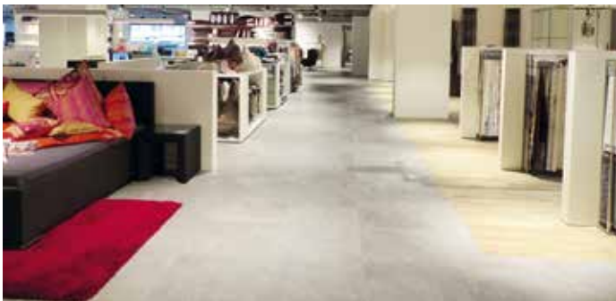
aus der Ausstellung