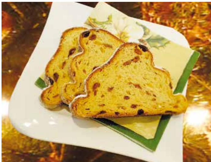
Im Café gibt es eine große Auswahl an Christstollen

Auf einen Besuch aller Generationen freut sich die Familie Regensburger mit ihrem Team.