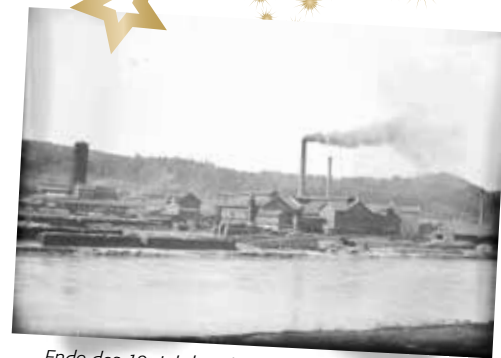
Ende des 19. Jahrhunderts wurde die „Cellulosefabrik“ gebaut, die viele Arbeitsplätze schaffte.

Übrigens: Die Schüler suchen zu den verschiedenen Themen noch private Fotos aus der Kaiserzeit. „Wir freuen uns, wenn sich Kelheimer bei uns melden!“ E-Mail-Adresse: elleseubert@aol.com BvS