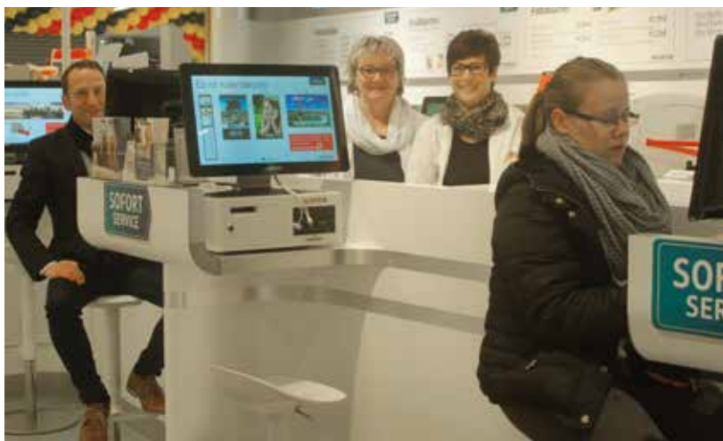
Begeisterung über den neuen Fujifilm-Bedienservice. Die Mitarbeiter helfen gerne!

Ein weiterer Blickfang: die 16 Meter lange Kosmetiktheke mit Make-up-Produkten für jeden Typ und Geschmack. Wowh ...!